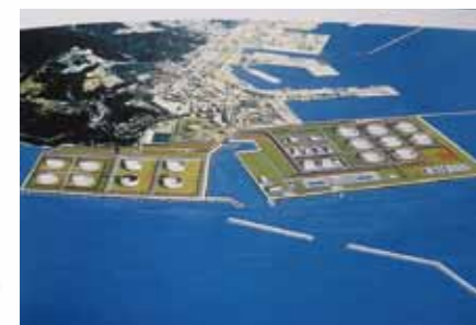
写真1 秋田国家石油備蓄基地

秋田石油備蓄基地の計画は、石油公団が実施する国家石油備蓄の一環として、船川港の海域を埋立造成するとともに、一部既存の埋立地を利用して、地中式タンク方式により、備蓄容量約450万KLの石油備蓄基地を建設するものである。石油備蓄基地は男鹿市の船川港地区に位置し、大量の原油を長期間貯蔵するので、計画の遂行にあたっては、安全、防災、環境保全の確保、地域との調和、機能性の確保及び経済性の確保を旨として進めた。(写真1)参照