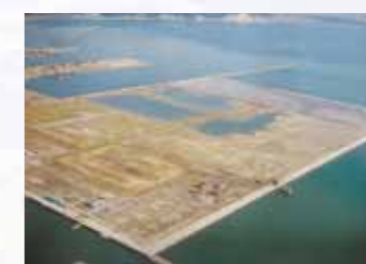
写真2 ポンプ掘削中の東基地全景(東I→II移動)

このように超軟弱で高含水掘削土やスレーキング化した大量の発生土605万m 3 を生石灰による改良により地中タンクの周辺の埋戻し、盛土に331万m 3 の掘削土を有効活用し、用地造成、地中タンク建設をより経済的に施工することが出来た。(写真2・3)参照