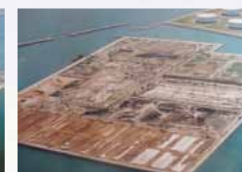
写真3 東I期1次掘削開始直後の東基地