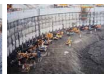
写真5 ロックアンカー施工状況

その規模・難度からいってもわが国で最大第一級の地下掘削工法である。特に泥岩地山は掘削による応力開放やスレーキングにより、膨張や膨圧の発生、強度の劣化を起こしやすい性質のため、土砂地山や硬岩地山に比べて特殊な