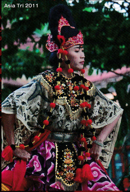
Asia Tri 2011

南アジアの熱 Air of Excitement from Southern Asia